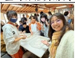
百工職場-向陽農場