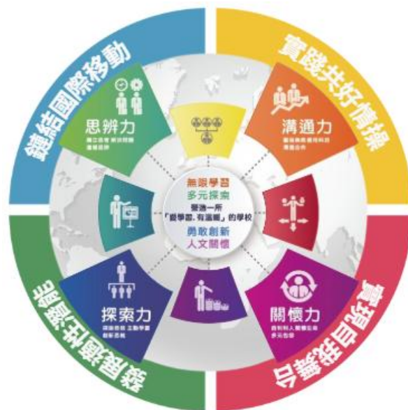
圖 1 學生學習具體目標圖