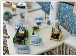
三語計畫生態箱製作