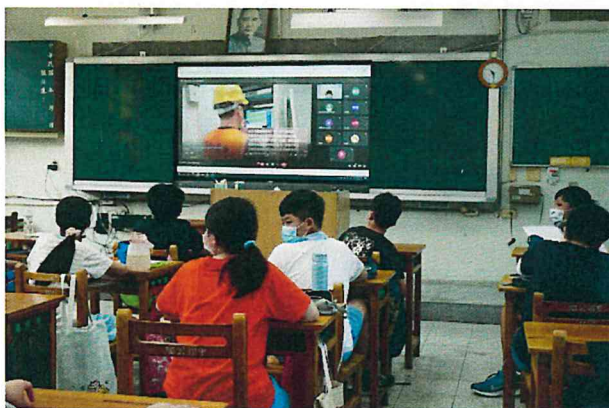
防災影片撥放與重點說明