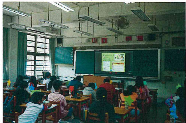
震災帶來的災害影響層面極廣