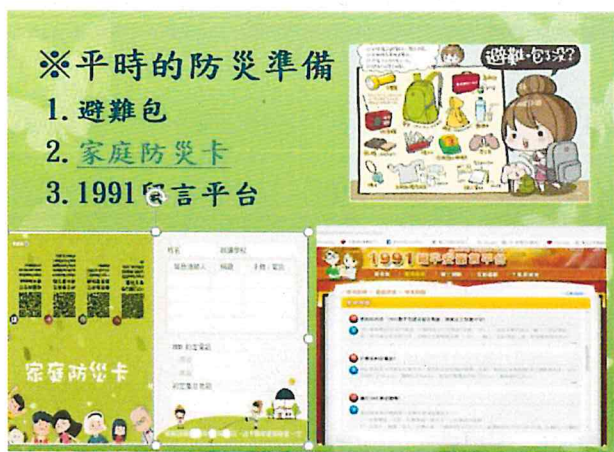
家庭防災卡與 1991 報平安留言平台投影片