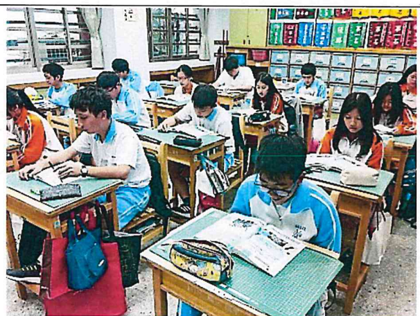
教師以英文進行課文問答