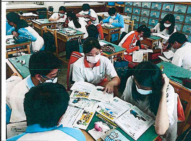
小組共讀並討論課文大意