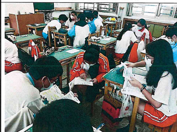
小組互助完成學習單