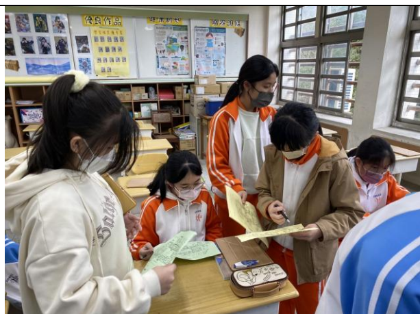
運用校園平面圖分析災害熱點區域