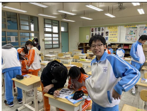
安全時事新聞討論