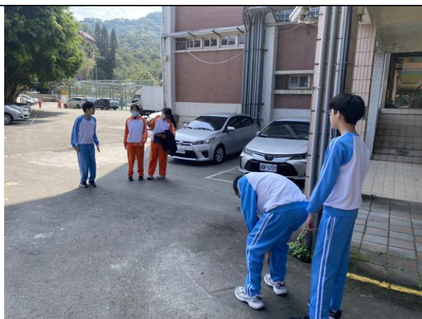
校園環境踏查與分析