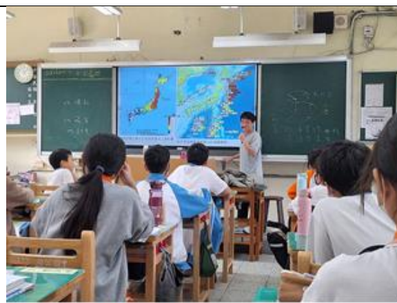
照片說明:介紹當時引發的海嘯高度