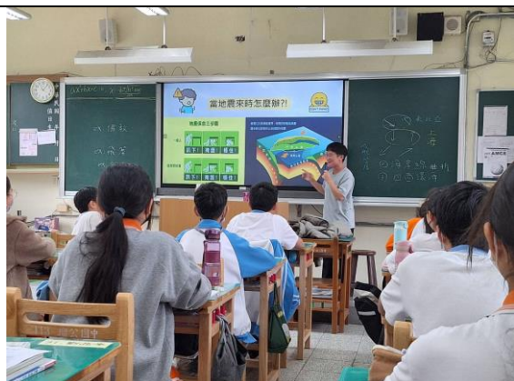
照片說明:認識台灣易有地震的原因，並認識地震三口訣-趴掩穩