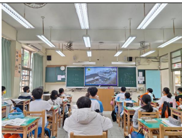
照片說明:圖說：觀看日本311大地震的相關影片