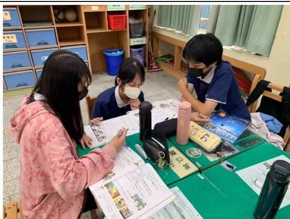
小組同心協力腦力激盪互助完成學習單