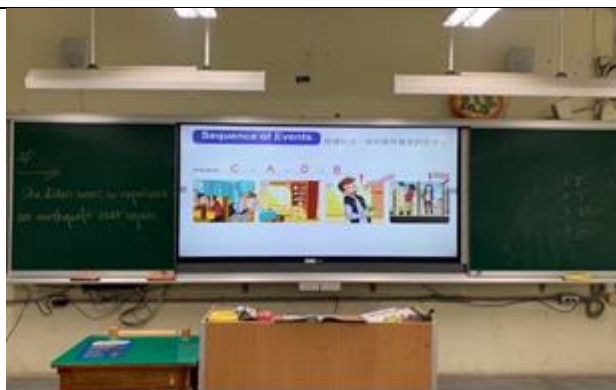
利用課文內容重組順序, 討論得出課文結論