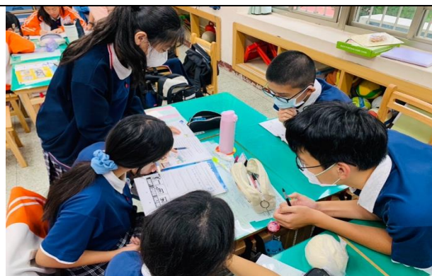
異質分組, 小組共讀並討論課文大意