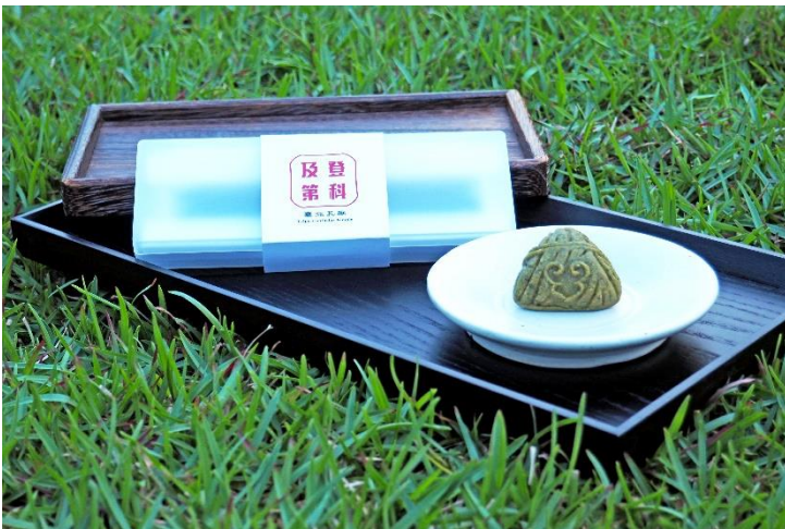
▲憑證(本年度准考證、報考證明或影本)兌換登科及第祈福文具組及如意包中糕