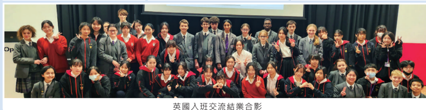
英國入班交流結業合影