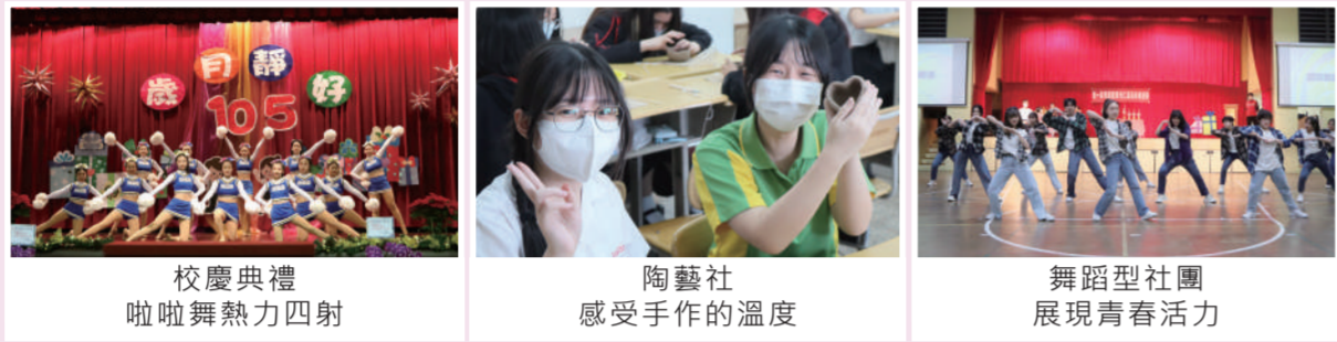
校慶典禮啦啦舞熱力四射 | 陶藝社感受手作的溫度 | 舞蹈型社團展現青春活力

本校重視多元發展，透過體驗、省思及實踐，建構自我價觀與意義，增強解決問題能力，強化團隊合作服務及促進全人發展。111學年度共設有24個社團，其中啦啦舞社成員盡情發揮舞蹈能力，於2022年全國啦啦隊挑戰賽，榮獲彩球指定動作高中組第一名佳績。參與比賽的過程，不怕辛勞，更能學習合作與人際互動。