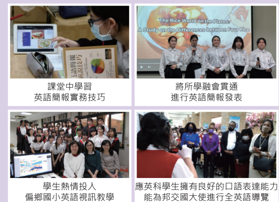
課堂中學習英語簡報實務技巧 | 將所學融會貫通進行英語簡報發表 | 學生熱情投入偏鄉國小英語視訊教學 | 應英科學生擁有良好的口語表達能力能為邦交大使進行全英語導覽

應用英語科在課程安排上格外重視活用英語的能力，除了部定必修的專業課程外，靜修規劃了句型、文法、口語表達、生活英語、職場英語、英語演說、新聞英文、專題實作、導覽英語、觀光英文、歐美繪本及小說選讀等課程，培養學生未來職場必備能力。學生亦在教師的指導下參加偏鄉小學英語視訊教學計畫，學習設計一堂堂有趣的課程，教學相長。