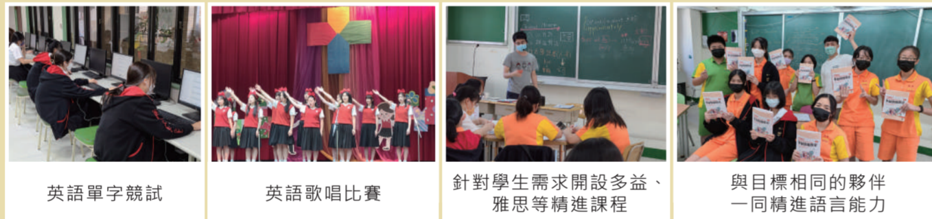
英語單字競試 | 英語歌唱比賽 | 針對學生需求開設多益、雅思等精進課程 | 與目標相同的夥伴一同精進語言能力

學校依學生需求開設多益、雅思等英檢課程。透過精緻小班的專業師資教學，讓學生高效運用週末黃金時段，使檢定課程與學校課程雙軌並進，英文實力能穩定地進步。此外，靜修亦辦理多益、多益普及、全民英檢等校園考，讓靜修同學能專注準備，並在熟悉的校園中應試。