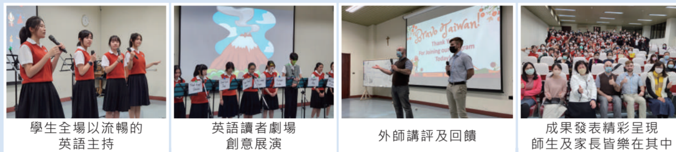
學生全場以流暢的英語主持 | 英語讀者劇場創意展演 | 外師講評及回饋 | 成果發表精彩呈現師生及家長皆樂在其中

高中雙語菁英班透過每週五堂專業外籍教師小班授課，接觸英語會話、基礎雅思、表達藝術、讀者劇場、小說閱讀、文法翻譯、學術寫作等專業課程。互動式適性教學，持續精進學生的英語聽說讀寫與獨立思辨能力。透過各種活動、競賽、作品成果發表，讓每位同學均有體驗式的學習。在趣味橫生的課堂中、師生熱絡的互動裡，發揮學以致用、學以助人的精神。期盼孩子們能以英語為工具，拓展視野，樂於學習，成為具備國際移動力與思維的新世代人才。