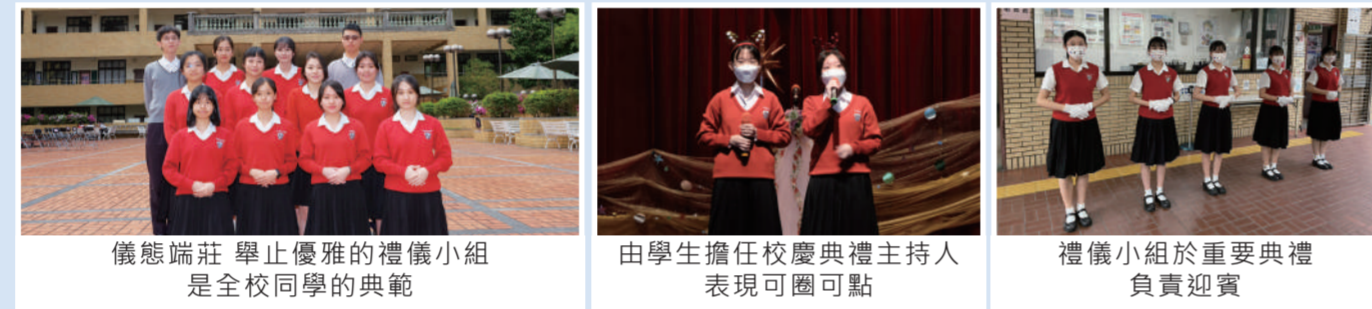
儀態端莊舉止優雅的禮儀小組是全校同學的典範 | 由學生擔任校慶典禮主持人表現可圈可點 | 禮儀小組於重要典禮負責迎賓

靜修每年遴選儀態優良、端莊大方的同學擔任禮儀小組，透過師長培訓及學長姐傳承，能在重要典禮中完美呈現靜修人的氣質。熱心服務的禮儀生們於各項典禮中擔任司儀或接待貴賓，彬彬有禮的儀態也能成為同學的楷模，幫助學校推展品格教育及生活教育。