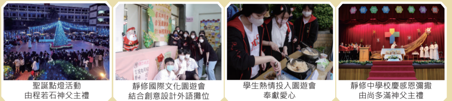
聖誕點燈活動由程若石神父主禮 | 靜修國際文化園遊會結合創意設計外語攤位 | 學生熱情投入園遊會奉獻愛心 | 靜修中學校慶感恩彌撒由尚多滿神父主禮

而校慶典禮主題為「流金·留今」。因每個學生都如「流金」般，正值可塑性高的年華，靜修的師長們期盼學生能找到自己的目標，在校園裡揮灑青春，努力形塑夢想的形狀，綻放璀璨光芒。此外，對於靜修而言，每分每秒都造就靜修的歷史，積累的歲月足跡也一步步推著靜修邁步往前，所以也願「留今」，留下每個今時此刻，創造永不退去的雋永燦爛。