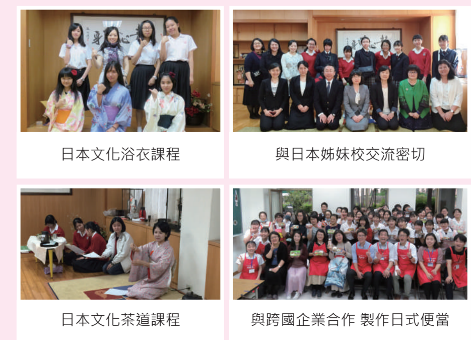
日本文化浴衣課程 | 與日本姊妹校交流密切 | 日本文化茶道課程 | 與跨國企業合作製作日式便當

三年紮實的日文課程，從基礎日語學習到輔導學生通過日文 N3 至 N1 檢定考，成績亮眼。透過茶道、浴衣和服、日本歌曲等豐富課程，深度認識日本文化，累積豐厚實力。由於靜修與日本多所姊妹校交流頻繁，學生有機會與日本學伴一對一互動，或申請至日本姊妹校進行一年交換。此外，本校畢業生可直升日本姊妹校聖加德琳大學就讀，且歷年聖加德琳的畢業生都能順利在日本就業。