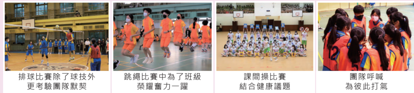
排球比賽除了球技外更考驗團隊默契 | 跳繩比賽中為了班級榮耀奮力一躍 | 課間操比賽結合健康議題 | 團隊呼喊為彼此打氣

體育競賽，除了能夠培養學生從事休閒活動的興趣，並促進學生的健康體能，更能在合作中增進學生彼此的情誼與班級的團隊氣氛。因此學校定期舉辦跳繩比賽、課間操比賽、排球比賽等團體競賽，讓學生在投入熱情參與的過程中，學會運動家的精神與團隊合作的素養。