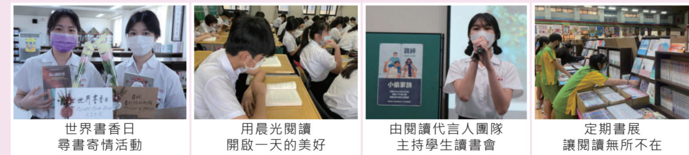
世界書香日尋書寄情活動 | 用晨光閱讀開啟一天的美好 | 由閱讀代言人團隊主持學生讀書會 | 定期書展讓閱讀無所不在

陶冶學生閱讀習慣，是奠定學生學習力的重要工作。靜修多年來推動圖書館利用教育、晨光閱讀、定期舉辦書展、行動書車、世界書香日等活動，並由學生擔任閱讀代言人，自發性舉辦讀書會，讓更多同學有機會接觸各類優良讀物，增廣見聞、培植閱讀素養。