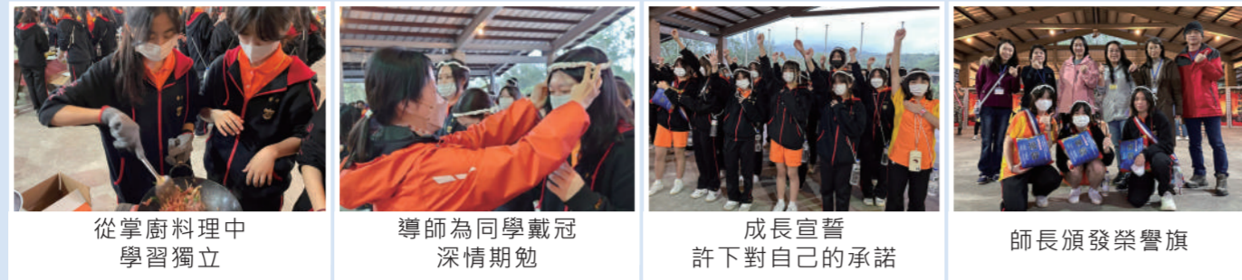
從掌廚料理中學習獨立 | 導師為同學戴冠深情期勉 | 成長宣誓許下對自己的承諾 | 師長頒發榮譽旗

高一成長營，透過野炊、漆彈、高空跳塔、探索教育活動，學生能展現秩序與紀律，並透過團隊合作增進班級凝聚力，甚至突破恐懼完成個人挑戰。最後的成年禮儀式上，許下對自己與班級的承諾，期許能為目標付出實踐，追求不斷的進步，以成就更好的自己。