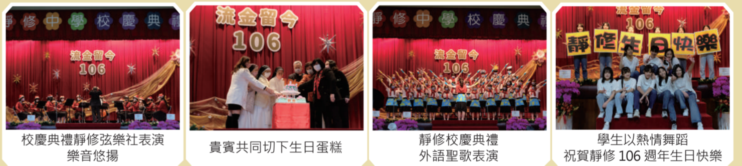
校慶典禮靜修弦樂社表演樂音悠揚 | 貴賓共同切下生日蛋糕 | 靜修校慶典禮外語聖歌表演 | 學生以熱情舞蹈祝賀靜修106週年生日快樂