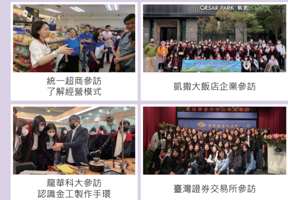
統一超商參訪了解經營模式 | 凱撒大飯店企業參訪 | 龍華科大參訪認識金工製作手環 | 臺灣證券交易所參訪

為使學生培養現代職場所須具備的知識及技能，本校商業經營課程豐富且實用。從商業概論、數位科技概論、會計學、經濟學等基礎課程，到投資理財、財務分析、商業溝通、財務會計應用、APP 設計開發等應用課程。在學期間師長積極輔導學生通過各項檢定，考取證照，也悉心指導學生參加專題製作競賽，屢獲佳績。學校亦安排至科大及企業參訪，帶領學生認識大學校系，了解產業現況。升學績效卓越，學生錄取臺科大、北科大等頂尖校系。