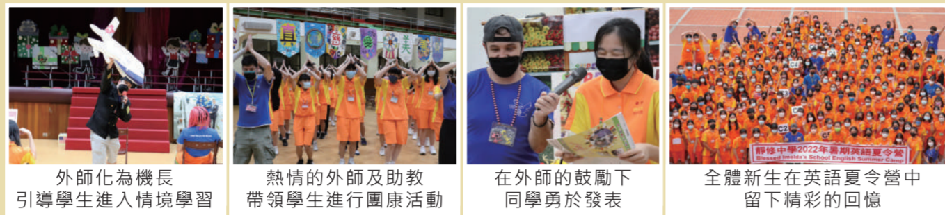
外師化為機長引導學生進入情境學習 | 熱情的外師及助教帶領學生進行團康活動 | 在外師的鼓勵下同學勇於發表 | 全體新生在英語夏令營中留下精彩的回憶

每年暑假，學校以各種暖心、活潑的活動迎接剛踏入靜修的新生們。為期五天的英語夏令營讓學生沉浸在全英語的學習環境中。透過各種主題式的活動，讓同學們從破冰、藝術創作、互動式遊戲到團隊競賽，很快地認識同儕，並建立正向、友善的互動模式。在外師及助教的引導下，能勇敢、自信的開口說英語，成功邁開國際的第一步。