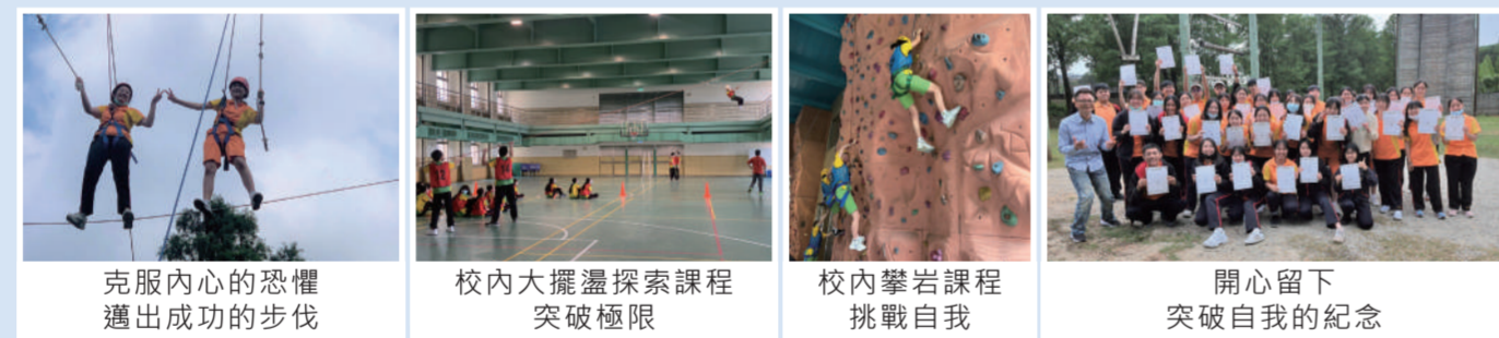
克服內心的恐懼邁出成功的步伐 | 校內大擺盪探索課程突破極限 | 校內攀岩課程挑戰自我 | 開心留下突破自我的紀念

本校自2007年開始發展探索教育為校本課程，更於2018年榮獲教育部「戶外教育成果」金牌獎。我們重視孩子的心靈成長，因此致力推動校內的「平面課程」、「大擺盪」、「攀岩」及校外「龍潭外展高空繩索活動」，期盼讓學生藉此學習與同儕互動和自我挑戰，以促進情境教學與生活連結，強化個人決策、問題解決與反思的能力與態度。