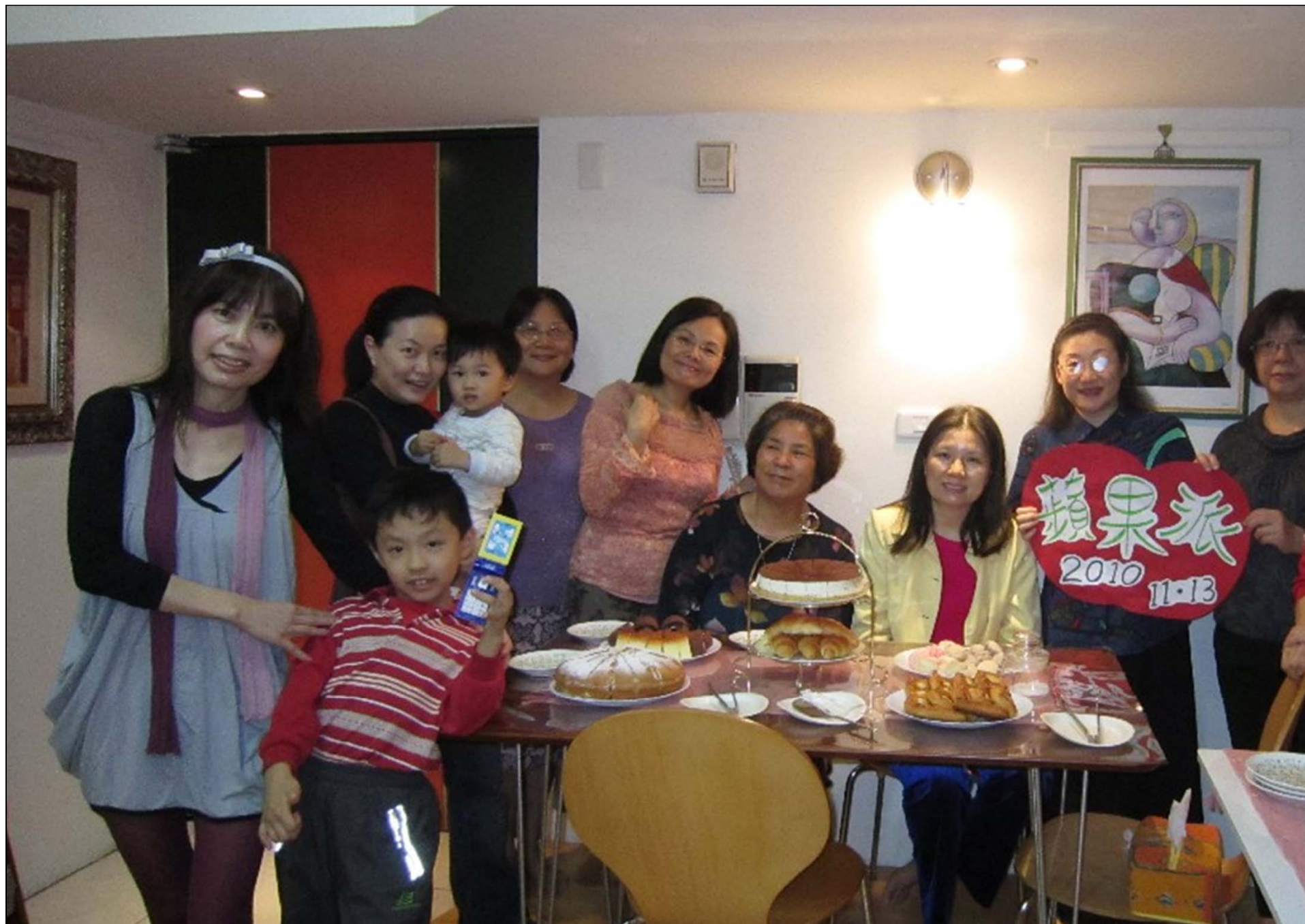
YA！溫馨的溜公蘋果派加上2個稚嫩的青蘋果