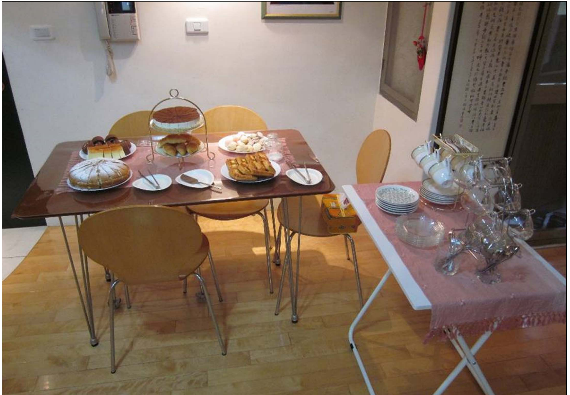
哇！令人食指大動的餐點和飲料