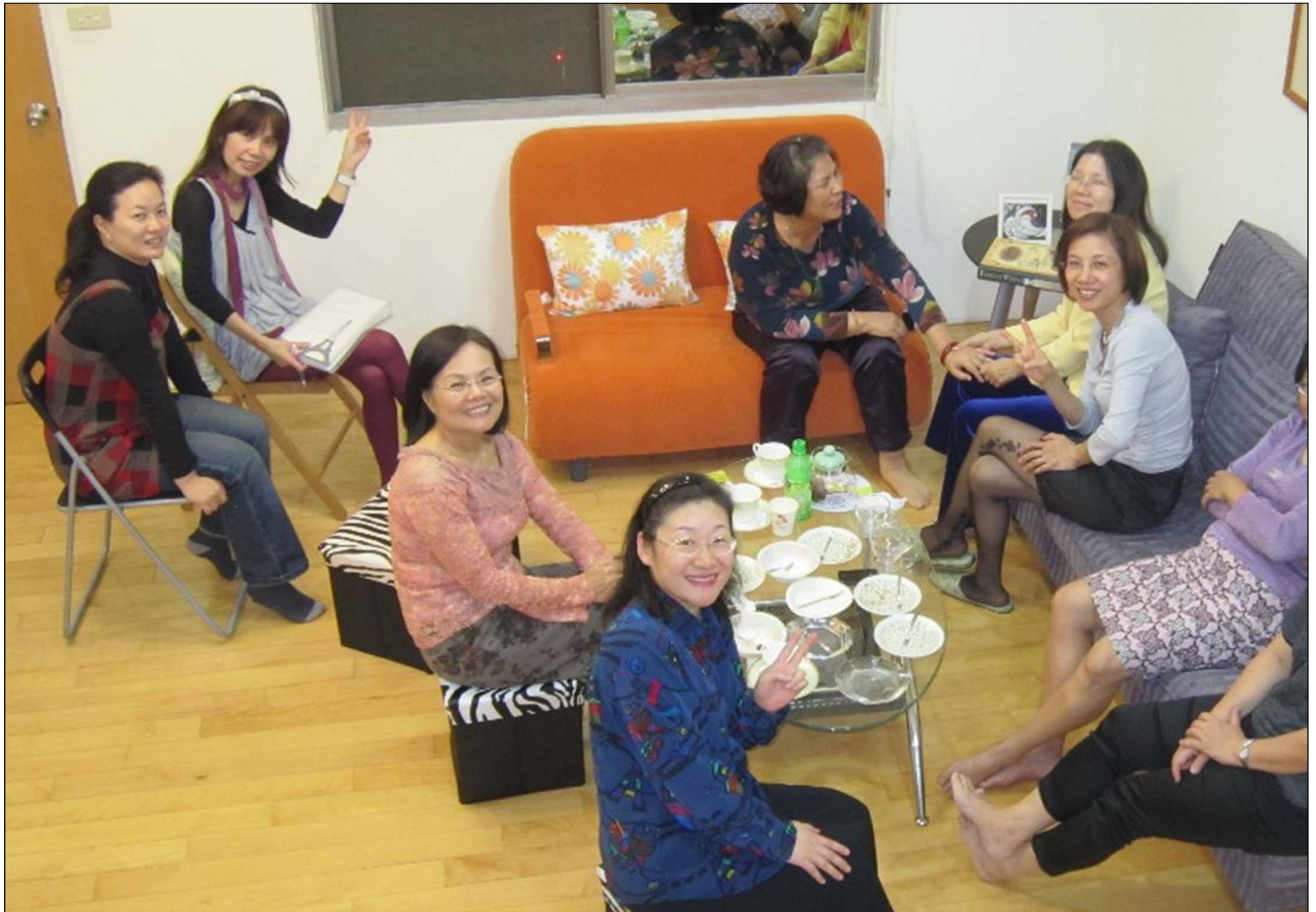
大家開心的吃吃喝喝閒話家常