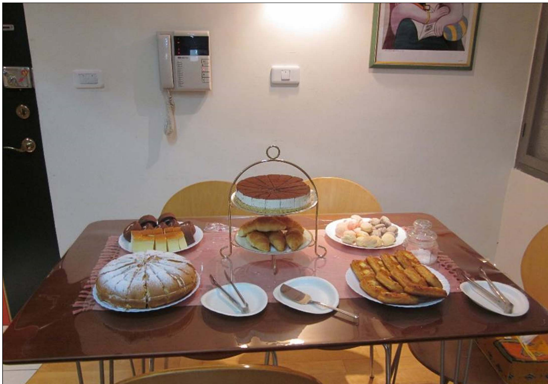
提拉米蘇、起士蛋糕、蘋果派、…令人垂涎欲滴