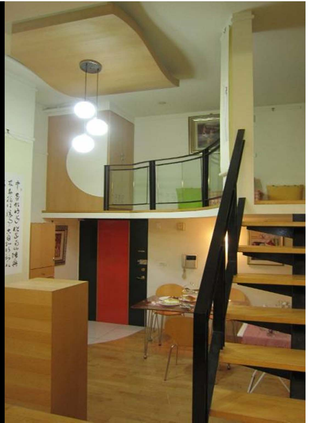
牆上書畫是才華洋溢的書畫家男主人的傑作