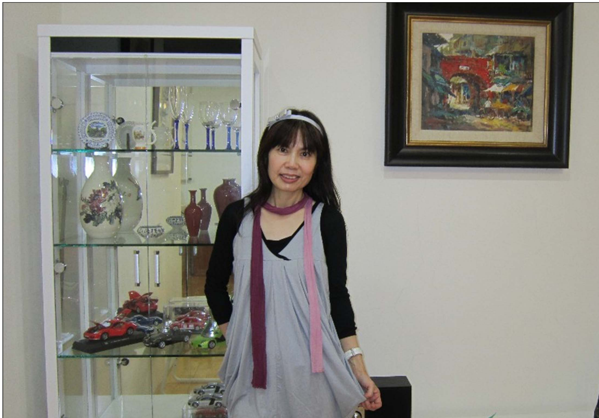
美麗女主人曼文和曼の屋