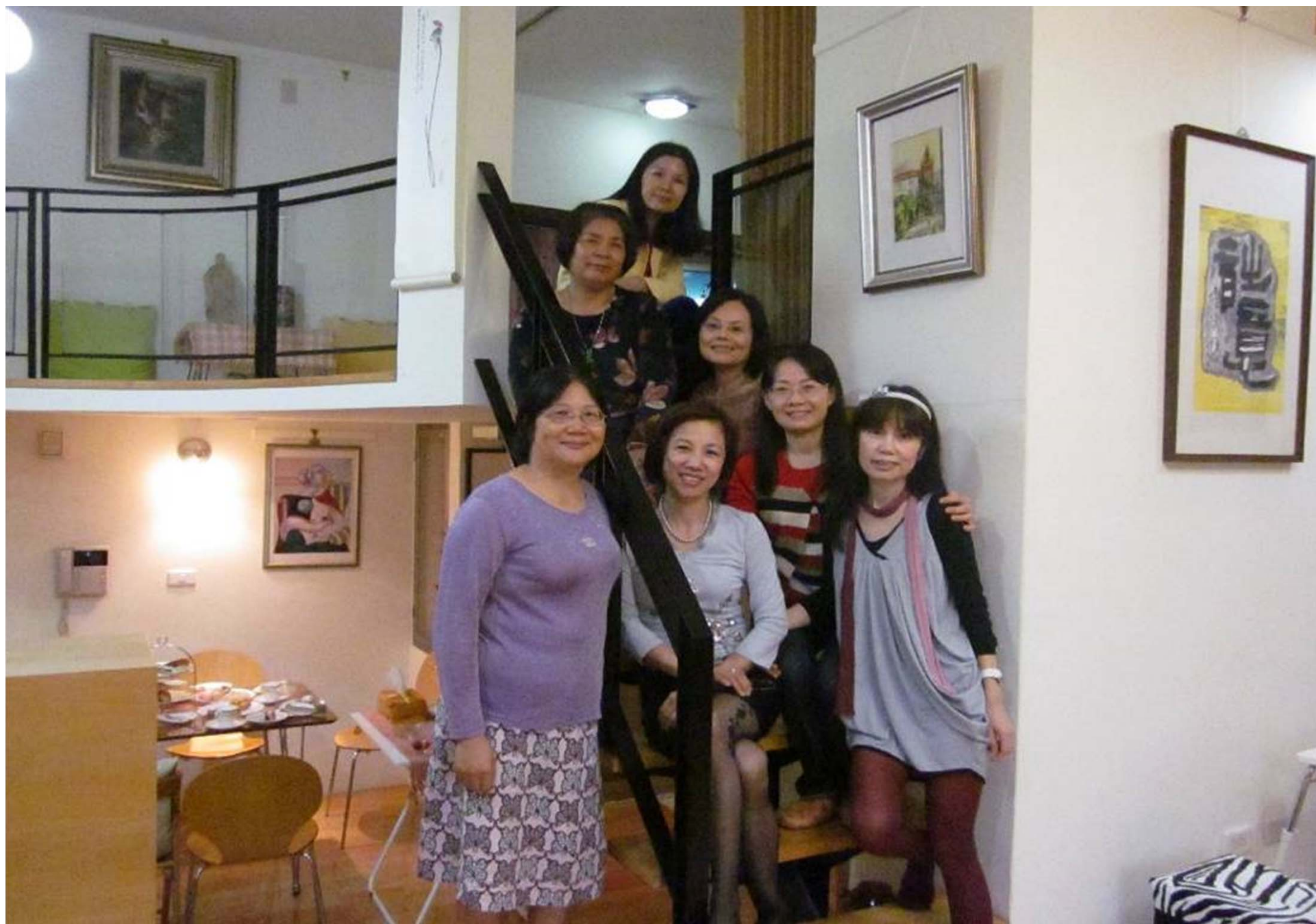
曼文來插花 也已算半個蘋果派了