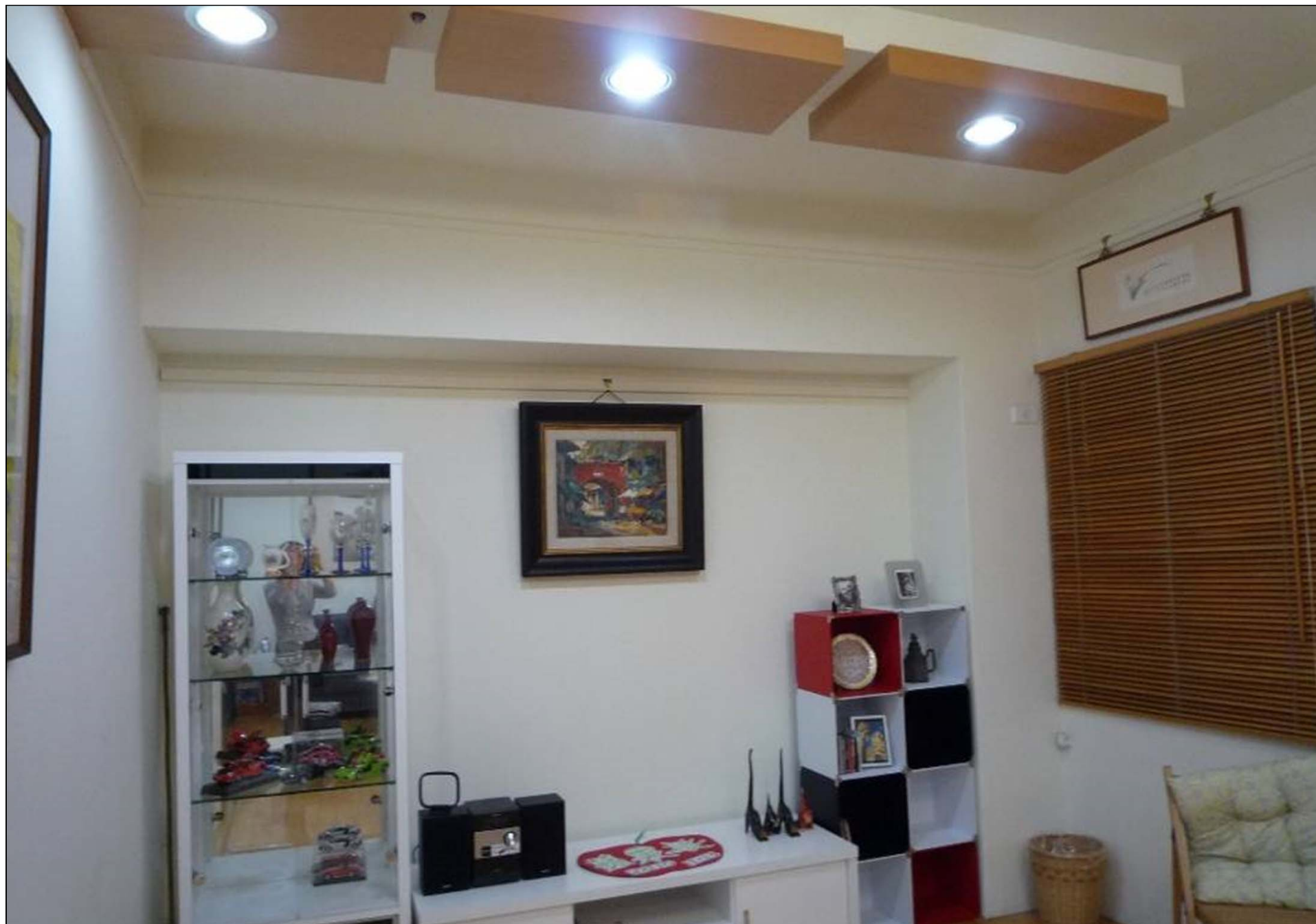
女主人巧思設計的精緻雅房