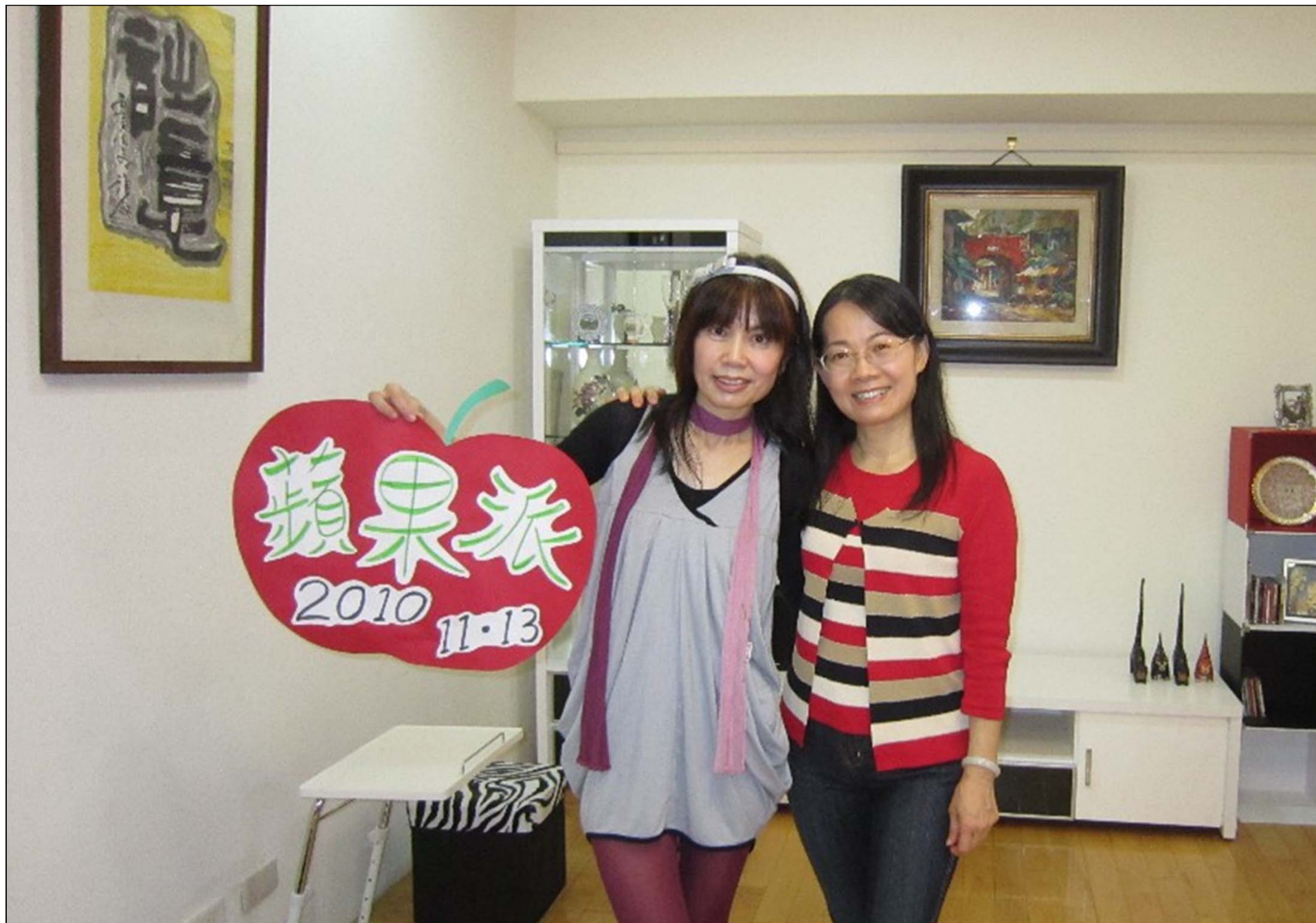
辛苦曼文熬夜到凌晨所製作的蘋果派