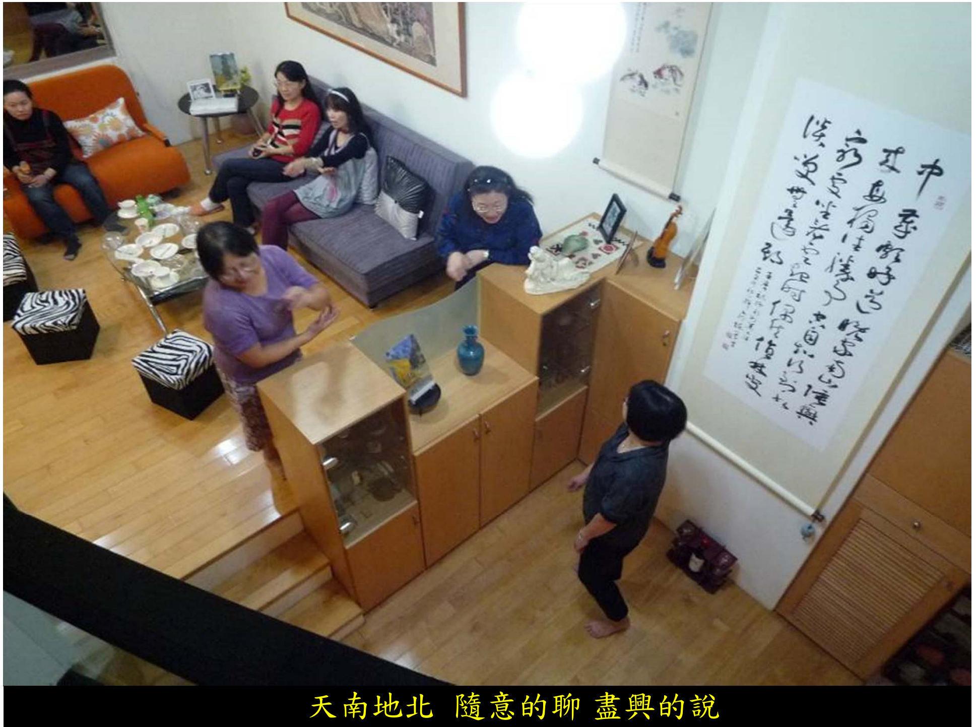
天南地北 隨意的聊 盡興的說