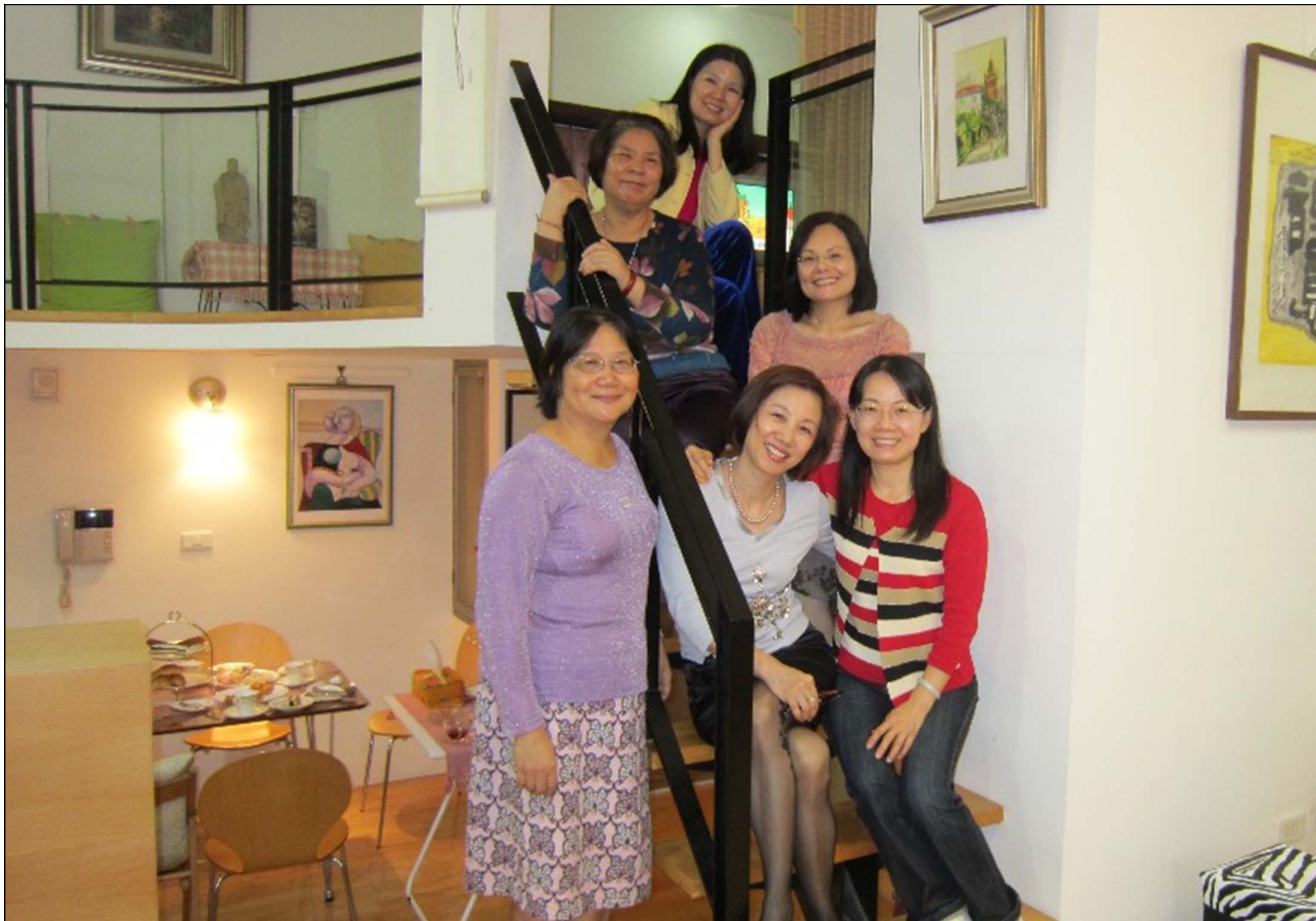
這一群是已退休的蘋果派