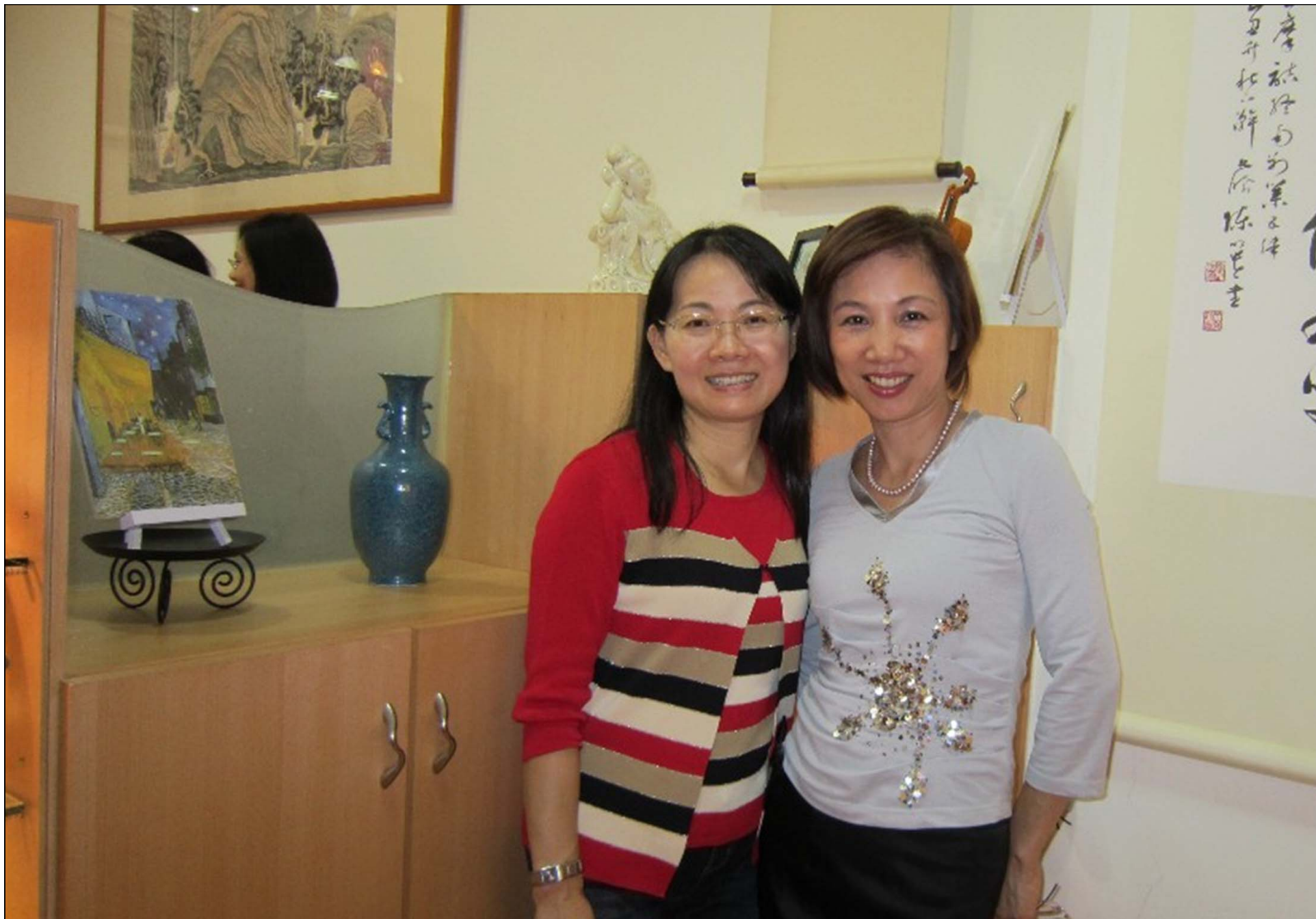
把握難得的相聚 留下美麗的情影